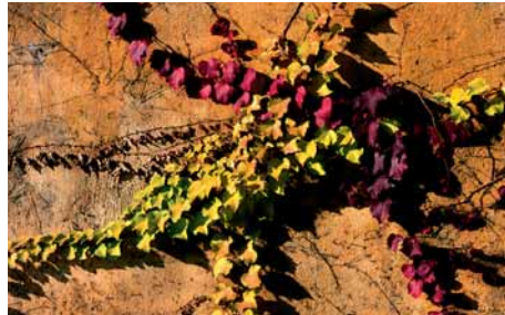
La llum del sol tardoral daura la vinya verge sobre els vells murs del Parc