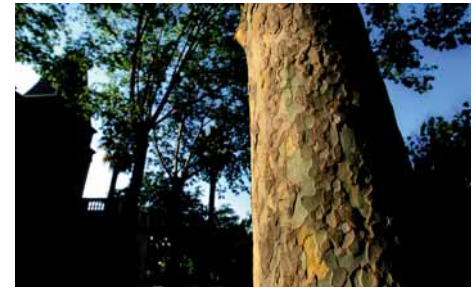
L'escorça dels plàtans es desprèn en capes

Híbrids d'una espècie americana i una d'oriental, cultivats des de molt antic, han estat lloats per poetes, filòsofs i guerrers. Conta Heròdot que Xerxes quedà tan atorat de la bellesa d'un plàtan, que va fer aturar les seves tropes tot un dia per tal de contemplar-lo i gaudir de la seva ombra, en marxar, va guarnir l'arbre amb una cadena d'or i el va custodiar amb una guàrdia. El seu nom prové del mot amb què l'anomenaven els grecs, platys, que significa "ample", en relació a l'amplitud de les fulles. Són arbres molt populars i nombrosos a les nostres ciutats. A l'estiu, les seves denses capçades omregen i refresquen rambles, passeigs, places i carrers. Poden viure fins a 600 anys i el contorn dels troncs pot arribar als 3 metres. Tenen les fulles grans i amb lòbuls ben marcats i l'escorça recoberta d'una pell groc verdosa que es desprèn en capes. Els fruits, rodons, contenen les llavors que es transporta el vent. Se'n fan plantacions a gran escala, les platanedes, per a l'explotació de la fusta.