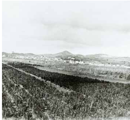
El pla i la vila de Molins a principis del segle XX

A petició de l'Ajuntament, el juny de 1985, un sector del pla es va declarar d'urgent industrialització. La Corporació Metropolitana primer i la Mancomunitat de Municipis de l'AMB després, van elaborar els corresponents plans i projectes urbanístics. En aquest context es va definir l'espai del futur parc de la Mariona. Des de la seva inauguració el 1995 i la posterior ampliació (sector comprès entre l'avinguda de Barcelona i el carrer de Salvador Seguí) del 2002, el Parc és un magnífic espai de lleure ciutadà i l'espai verd urbà més important de Molins de Rei.