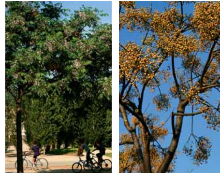
Mèlies a la primavera i a l'hivern

A les placetes els arbres fan goig de veure, sobretot, en època de floració: l' arbre de l'amor , amb flors liles, cada primavera és un esclat de color, quan encara es troba despulat de fulles. Els pissardis no es queden enrere amb les seves flors rosades, que contrasten amb el tons foscos dels troncs i les branques. Les flors de les mèlies , perfumades i de color blau lilós, s'agrupen en grans poms per fer-se més visibles; les mèlies deuen ser força presumides perquè a l'hivern segueixen guarnides pels fruits, unes boletes de color terrós, que pengen de les branques nues i es dauren amb la llum del sol.