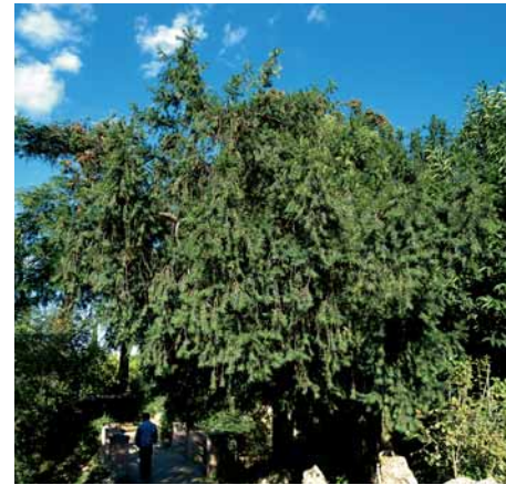
El Teix de 4 Peus

centenaris, de port singularíssim, damunt d'un sotabosc entapissat d'heura que comparteixen boixos, llorens, marfulls, arços i garrics. Com a arbres singulars cal citar especialment una alzina i un teix (prop del pont), dos pins de Canàries "Els Bessons" 1) en el camí de baix del llac.