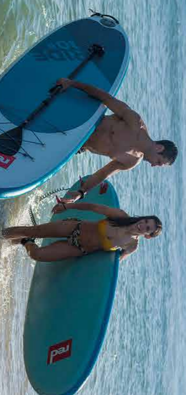
Platja de Castelldefels Playa de Castelldefels

Contacta amb nosaltres | Contacta con nosotros